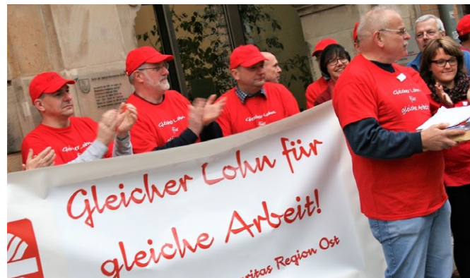
Caritas-Beschäftigte in der Region Ost beteiligen sich an der Aktion „Gleicher Lohn für gleiche Arbeit.“

Mit dem Argument der nahezu flächendeckenden Billiglöhne, hatten die ostdeutschen Bundesländer nach der Wiedervereinigung um Investitionen und wirtschaftliche Neuansiedlungen geworben – mit zweifelhaftem Erfolg. Inzwischen ist der Politik bewusst, dass sich auf diese Weise keine Fachkräfte binden, geschweige denn anwerben lassen. Die Bundesländer im Osten Deutschlands bemühen sich jetzt verstärkt um eine tarifliche Entlohnung. Höchstrichterliche Urteile haben inzwischen eine tarifliche Vergütung als grundsätzlich wirtschaftlich bestätigt.