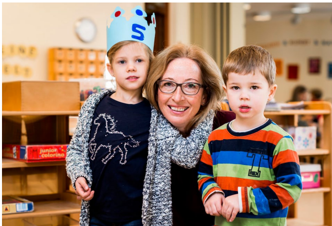
Ein beruflicher Wechsel von einer Caritas-Einrichtung in eine Einrichtung der verfassten Kirche konnte bislang Nachteile mit sich bringen.