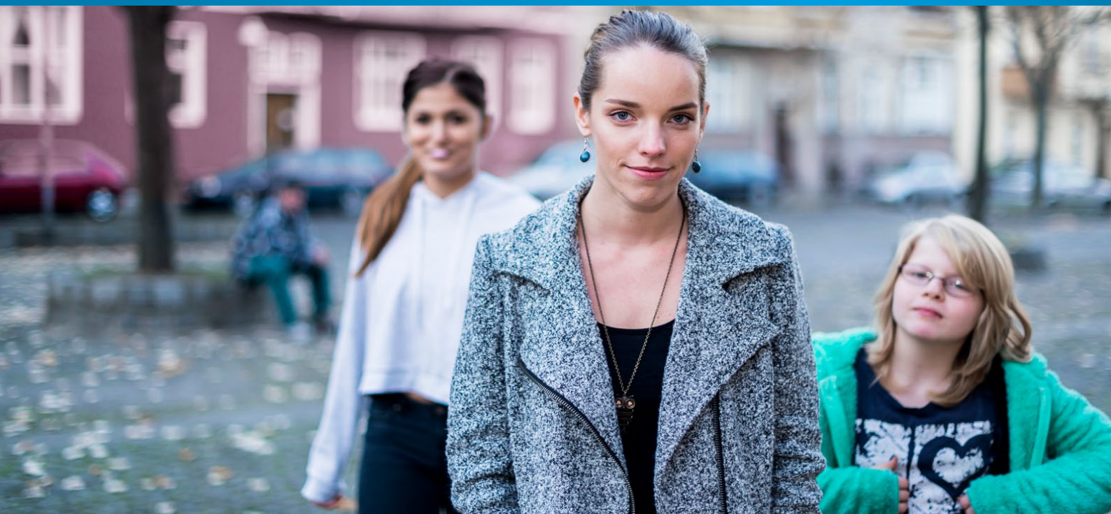
Die Beschäftigten in der Caritas-Jugendhilfe wollen an der allgemeinen Lohnentwicklung teilhaben.