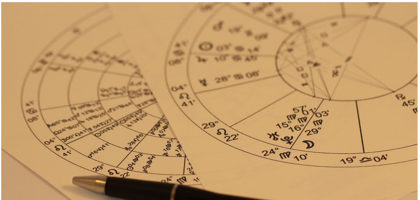
Die Zukunft für die neue Amtszeit lässt sich nicht in den Sternen lesen.

Zugegeben, ab und an lese auch ich schon mal gerne Horoskope. Zum Schicksal der Arbeitsrechtlichen Kommission (AK) ist in den einschlägigen Wartezimmerpublikationen allerdings eher wenig zu finden. Da gibt das chinesische Horoskop schon mehr her. Die letzte Amtszeit der AK beispielsweise begann 2013, dem Jahr der Wasser-Schlange. Prophezeit wurde ein Jahr, in dem wir mit dem Unerwarteten rechnen sollten – eine Zeit, in der sich alles hätte verändern und auf den Kopf stellen können. Eine persönliche Bewertung von Rolf Cleophas.